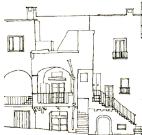
图16 ①、② 侧立面

Yuta Inamasu , ingegnere, ha conseguito un dottorato di ricerca sulle città pugliesi nel Dipartimento di Ingegneria edile presso l'Università di Hosei, dove svolge attività di ricerca.